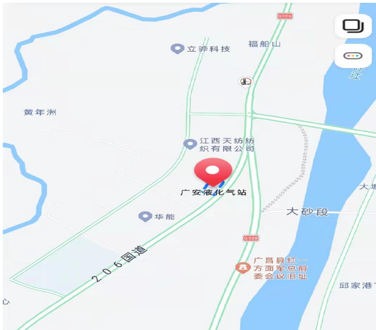
图 2-1 企业地理位置图