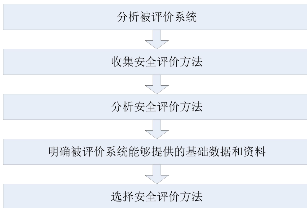
图5-1 安全评价方法选择过程